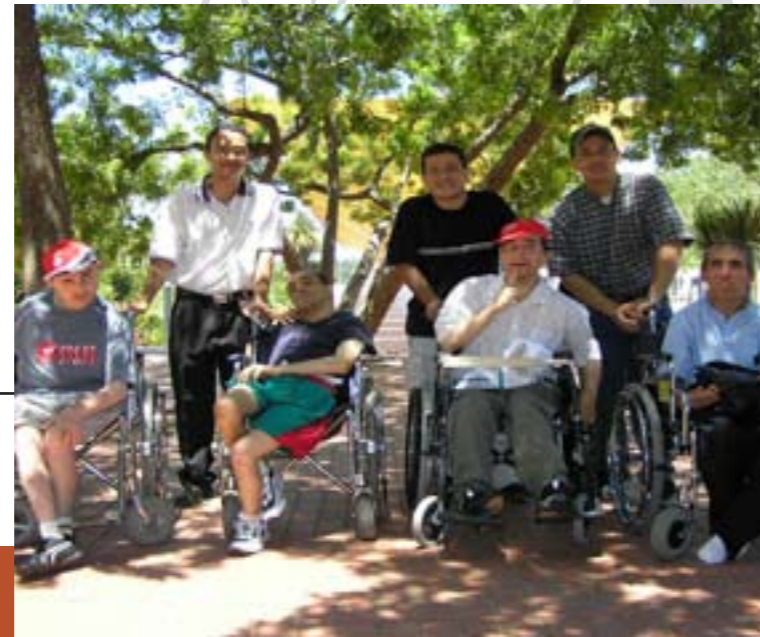
Atendiendo a los discapacitados de Fátima.

La JMJ fue una experiencia gozosa de Fe, Catolicidad y unión afectiva con el Santo Padre.