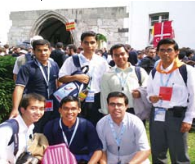
Alumnos del Bidasoa en la JMJ.

Un año más el Colegio Eclesiástico Bidasoa ha permanecido abierto durante todo el verano, desarrollando actividades para aquellos alumnos que no han podido regresar a sus casas. Como es habitual, han ayudado a algunos sacerdotes de distintos lugares de España en sus tareas parroquiales, en los campamentos que organizan, asistiendo en residencias de ancianos y hospitales, etc. Pero, sin duda alguna, podemos decir que el verano de Bidasoa ha estado marcado por un gran acontecimiento, la Jornada Mundial de la Juventud en Colonia, que fue celebrada en agosto, a la que acudieron un grupo de 50 seminaristas y formadores del Bidasoa. Un viaje inolvidable en el que tuvieron la oportunidad de detenerse en Ars para venerar los sagrados restos de San Juan María Vianney, Patrono del clero secular, y encomendar a su intercesión los frutos de su camino vocacional y de esa Jornada. Una vez en Colonia, los alumnos asistieron al acto del Papa Benedicto XVI con los seminaristas en la